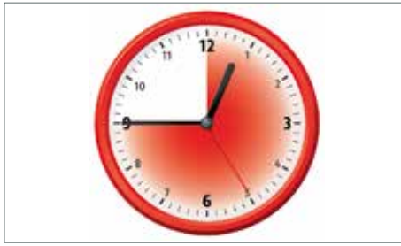
Flexibilität muss sich in der Honorierung ausdrücken ...