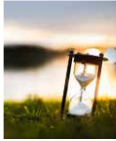
Weniger arbeiten, weniger Überstunden machen ...