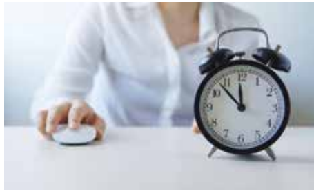
Neue Weiterbildungsordnung soll spätestens 2019 stehen ...